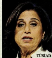
TÜSIAD Başkanı Cansel Başaran Symes

Ülkemize ve milletimize karşı girişilen bu darbe girişimini tanımıyoruz. Halkın iradesiyle seçilmiş meşru hükümete karşı girişilen bu kanunsuz kalkışmanın karşındayız. Türk milleti olarak her türlü darbe girişiminin karşısında olmalı, demokrasimizi savunmalıyız. Türk iş dünyası olarak devletimizin ve milletimizin yanındayız. Demokrasiden yanayız.