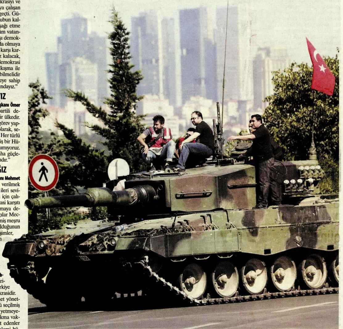
Darbe girişimine karşı halk destansı bir karşılık verdi. Tankların üzerine çıkan halk, girişimin başarısız sonuçlanmasında başarılı oynadı.

İş dünyası darbe girişimine karşı ilk dakikadan itibaren tek ses tek yürek olarak tepki mesajları yayınladı. Türk milletinin seçimle başa getirdiği hükümetinin arkasında olduğu belirtilen mesajlarda, ülkenin bu kalkışmadan güçlenerek çıkacağı vurgulandı.