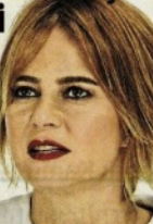
KAGİDER Başkanı Sanem Oktar