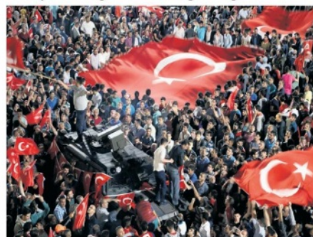
Askeri darbe girişimine tepki gösteren halk, Türk bayraklarıyla meydanlara inerken darbeye kullanılan zırhlı araçlara da çepeçevre kusatarak hareketsiz kaldı.