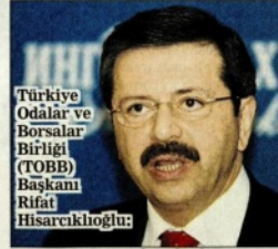
Türkiye Odalar ve Borsalar Birliği (TOBB) Başkanı Rifat Hisarcıklıoğlu:

Önceki gece yaşanan darbe girişimine iş dünyasından lanet yağdı. Türkiye'nin büyük bir sınavdan başarıyla çıktığını vurgulayan patronlar, demokrasi ve milli iradeye sahip çıkma çağrısı yaptı