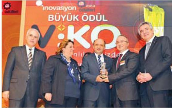
Istanbul Sanayi Odası'nın Inovasyon Ödülleri'nde Büyük Ödül'e Viko Elektrik Elektronik layık görüldü.