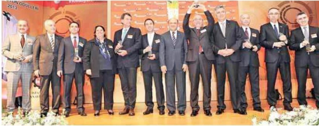
ISO Inovasyon Ödüllerinde, Büyük Ödül'ün sahibi Viko olurken, Jüri Özel Ödülü'nü HAVELSAN aldı.