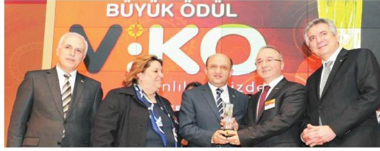
İSO'nun İnovasyon Ödülleri sahiplerini buldu. Törende ödülleri Sanayi Bakanı Işık dağıttı.