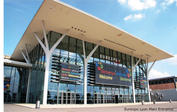
Eurexpo Lyon Main Entrance

Lyon Ticaret Odasına kayıtlı 750 Türk şirketi, Lyon meslek odasına kayıtlı 1500 Türk şirketi bulunmaktadır.