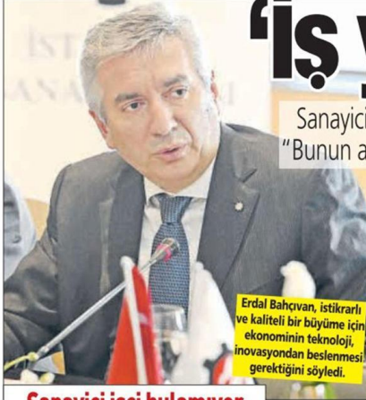
Erdal Bahçivan, istikrarlı ve kaliteli bir büyüme için ekonominin teknoloji, inovasyondan beslenmesi gerektiğini söyledi.

Sanayiciler olarak her yıl dünya kadar Damga Vergisi ödediklerini söyleyen ISO Başkanı Erdal Bahçivan, "Bunun adı, iş yapmayı, Türkiye ekonomisine kazanç sağlama peşindeki girişimciye cezalandırmaktır" dedi