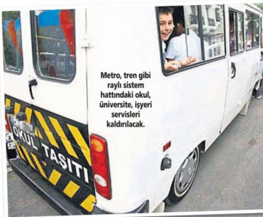
Metro, tren gibi raylı sistem hattındaki okul, üniversite, işyeri servisleri kaldırılacak.