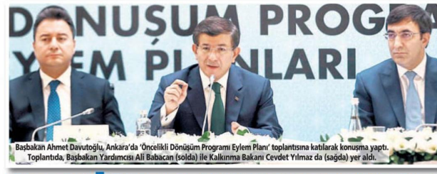
Başbakan Ahmet Davutoğlu, Ankara'da 'Öncelikli Dönüşüm Programı Eylem Planı' toplantısına katılarak konuşma yaptı. Toplantıda, Başbakan Yardımcısı Ali Babacan (solda) ile Kalkınma Bakanı Cevdet Yılmaz da (sağda) yer aldı.

Başbakan Ahmet Davutoğlu, 2018'e kadar gerçekleştirilecek ekonomik dönüşümle ilgili yol haritasını çizdi. Buna göre; alınan önlem ve teşviklerle milli gelir 4 yıl sonra 1.3 trilyon dolara çıkacak, işsizlik yüzde 7'ye inecek. Ancak bu hedefler geçen ay açıklanan Orta Vadeli Program'ın çok üzerinde!