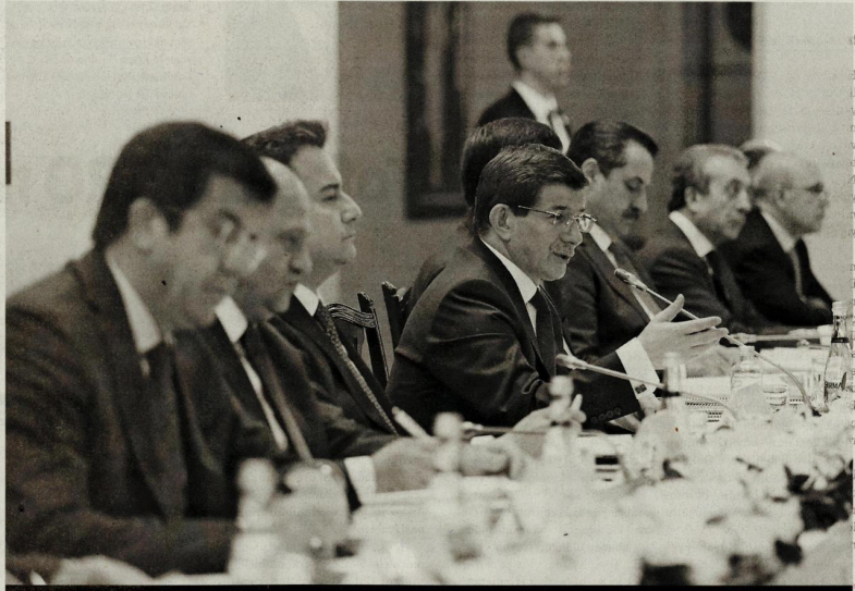
Öncelikli Dönüşüm Programı'nda yer alan 9 maddelik eylem planı ve hedefler

Ote yandan, gümrük kapılarına ilişkin bir soruyu yanıtlayan Gümrük ve Ticaret Bakanı Nurettin Canikli, kısa süre içinde Gürcistan, İran ve Irak'a yeni kapılar açacağını, Sarp, Kapıkule ve Habur sınır kapılarında da tek durak işleminin başlayacağını açıkladı. Sanayi Bakanı Fikri Işık da Türkiye'nin yerli otomobile tercihini hibrit-elektrikli araç olarak belirlediğini, geliştirme çalışmalarının yanında, üretici ile görüşmenin de başladığını açıkladı.