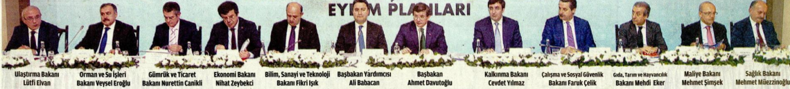
Ulaştırma Bakanı Lütfi Elvan, Orman ve Su İşleri Bakanı Veysel Eroğlu, Gümrük ve Ticaret Bakanı Nurettin Canikli, Ekonomi Bakanı Nihat Zeynepci, Bilim, Sanayi ve Teknoloji Bakanı Filiz Işık, Başbakan Yardımcısı Ali Babacan, Başbakan Ahmet Davutoğlu, Kalkınma Bakanı Cevdet Yılmaz, Çalışma ve Sosyal Güvenlik Bakanı Faruk Çelik, Gıda, Tarım ve Hayvancılık Bakanı Mehdi Eker, Maliye Bakanı Mehmet Şimşek, Sağlık Bakanı Mehmet Müezzinoğlu