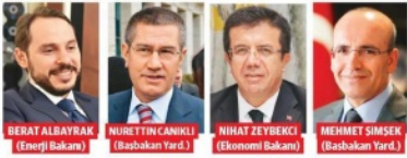
BERAT ALBAYRAK (Enerji Bakanı) NURETTİN CANIKLI (Başbakan Yard.) NİHAZ ZEYBEKCI (Ekonomi Bakanı) MEHMET SİMSEK (Başbakan Yard.)

Ekonomi çevreleri ve piyasaların merakla beklediği ekonomi kabinesinde ciddi bir değişim yaşanmadı. İş dünyası ve uluslararası piyasaların güven duyduğu ekonomi kabinesi 2 değişikliğe yoluna devam ediyor. 8 bakanın görevinden alındığı, 4 bakanın ise yer değiştirdiği 65'inci Binali Yıldırım hükümetinde ekonomi kabinesinde, Kalkınma Bakanı Cevdet Yılmaz yerini kendisi gibi Devlet Planlama Teşkilatı Müsteşarı (DPT) kökenli Başbakan Yardımcısı Lütfi Elvan'a bıraktı. Başbakan Yardımcısı olarak görev yapan Mehmet Simsek, yeniden Başbakan Yardımcılığına getirildi.