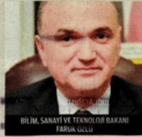
BİLİM, SANAYİ VE TEKNOLOJİ BAKANI FARUK ÖZLÜ