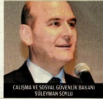
ÇALIŞMA VE SOSYAL GÜVENLİK BAKANI SÜLEYMAN SOYLU