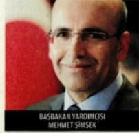
BASBAKAN YARDIMCISI MEHMET ŞİMŞEK

Ekonomi kurmayları arasında 2 yeni isim katıldı. TBMM Millî Savunma Komisyonu Başkanı ve AK Parti Düzce Milletvekili Faruk Özlü, bilim, sanayi ve teknoloji bakanı olarak görevlendirildi. AK Parti Kars Milletvekili Ahmet Arslan da ulaştırma, denizcilik ve haberleşme bakanı oldu. Arslan, daha önce bakanlıkta çeşitli kademe-lerde görev yapmıştı. EKONOMİ SERVİSİ