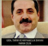
GIDA, TARIM VE HAYVANCILIK BAKANI FARUK ÇELİK