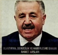
ULAŞTIRMA, DENİZCİLİK VE HABERLEŞME BAKANI AHMET ARSLAN

AK Parti Genel Başkanı ve Başbakan Binali Yıldırım tarafından kurulan 65. Hükümet'in ekonomi yönetimi belirlendi. Yeni ekonomi yönetimi değerlendirildi. İddiyası, atıklar ve reformlar için birlikte çalışılması gereğine vurgu yapıldı.