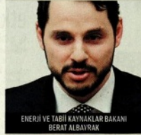
ENERJİ VE TABİİ KAYNAKLAR BAKANI BERAT ALBAYRAK