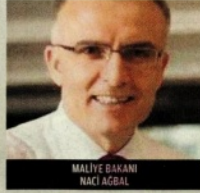
MALİYE BAKANI NACI AĞBAL