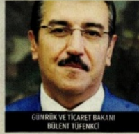
GÜMRÜK VE TİCARET BAKANI BÜLENT TÜFENKCI