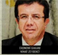
EKONOMİ BAKANI NİHAT ZEYBEKCI