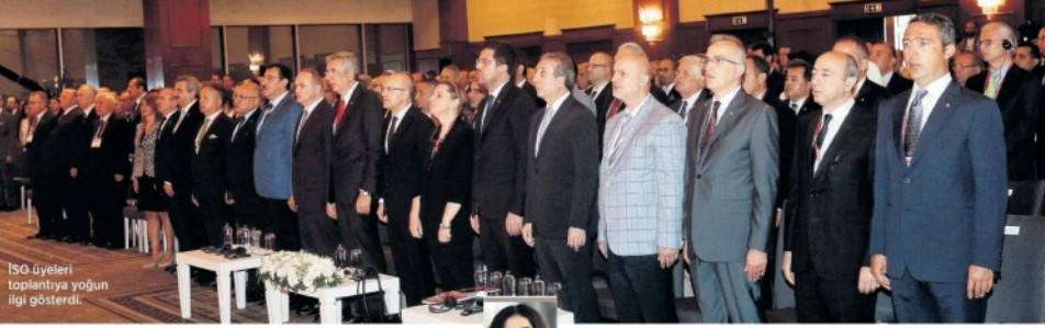
ISO üyeleri toplantıya yoğun ilgi gösterdi.