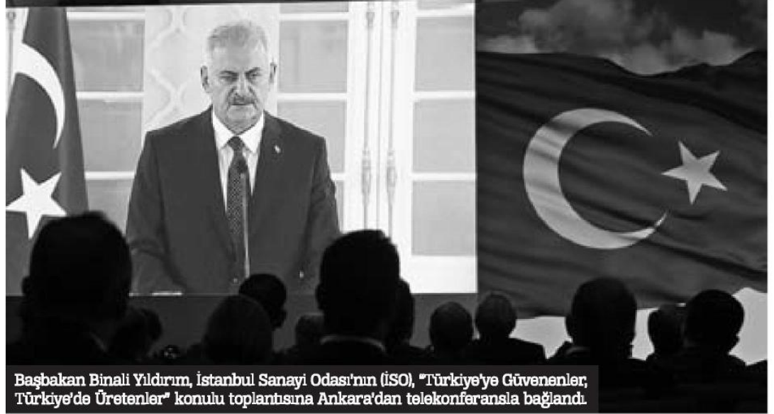
Başbakan Binali Yıldırım, İstanbul Sanayi Odası'nın (İSO), "Türkiye'ye Güvenenler, Türkiye'de Üretenler" konulu toplantısına Ankara'dan telekonferansla bağlandı.

■ 15 Temmuz gecesinde Türkiye büyük bir uçurumun eşiğinden döndü. Ülkemizin geleceğine kastedenler, demokrasisini yok etmeye çalışanlar, Gazi Meclisimizi bombalamaktan bile çekinmeyen alçaklar, eğer muvaffak olsalardı, bugün başka bir Türkiye'yi konuşuyorduk. Darbeyle yönetimi ele geçirilmiş, milli irade ortadan kaldırılmış ve dünya gelişen ülkeler liginden düşmüş, 3. dünya ülkeleri arasında bir Türkiye'yi konuşacaktık. ■ Ekonomik gelişmenin olmazsa olmazı