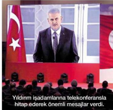
Yıldırım işadamlarına telekonferansla hitap ederek önemli mesajlar verdi.

15 Temmuz gecesinin, çok karanlık bir gece olduğunu hatırlatan Yıldırım şöyle konuştu: "15 Temmuz gecesinde Türkiye büyük bir uçurumun eşiğinden döndü. Ülkemizin geleceğine kastedenler, demokrasisini yok