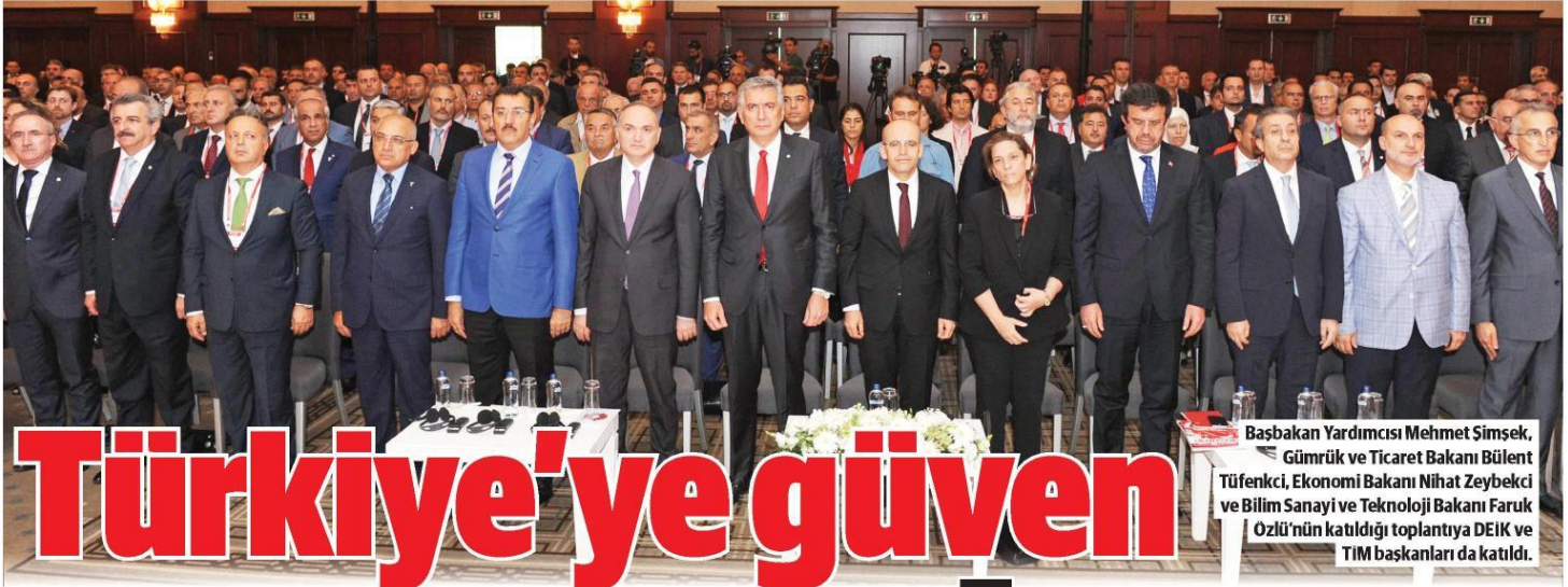
Başbakan Yardımcısı Mehmet Şimşek, Gümrük ve Ticaret Bakanı Bülent Tüfenkci, Ekonomi Bakanı Nihat Zeybekci ve Bilim Sanayi ve Teknoloji Bakanı Faruk Özlü'nün katıldığı toplantıya DEİK ve TIM başkanları da katıldı.