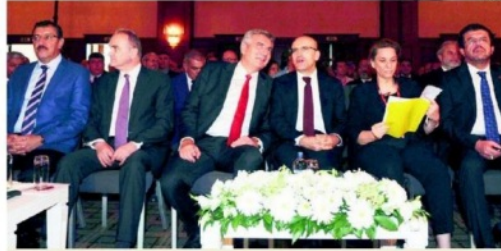
Toplantıya, Başbakan Yardımcısı Mehmet Şimşek, Gümrük ve Ticaret Bakanı Bülent Tüfenkci, Ekonomi Bakanı Nihat Zeybekci ve Sanayi Bakanı Faruk Özlü katıldı.