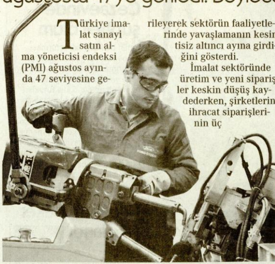
İmalat sanayi, 2009'dan bu yana en düşük seviyede.