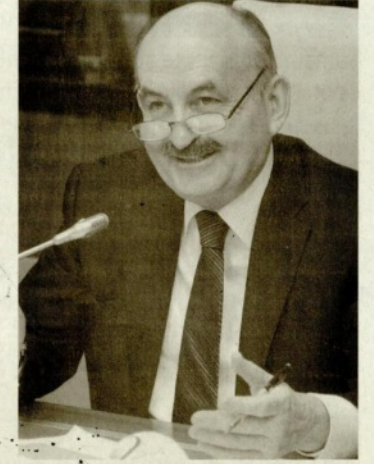
anneanne-babaanne projesinin imzasını atacağız" şeklinde konuştu.

Yaklaşık bir buçuk ay önce İstanbul Sanayi Odası 'nda bir işverenin kürsüye çıkarak "Sizin bu yarı zamanlı doğum yapmış anneyi 6 yaşına kadar çocuğunun yanında olması ve yarı zamanlı çalışma imkanı tanımamız kadın istihdamına zarar getirdi" dediğini ifade eden Müezzinoğlu, buna önerileri olduğunu kaydetti. Bakan Müezzinoğlu, söz konusu projeye ilişkin olarak, "Bizim bu projeye önerimiz var bu da anneanne babaanne projesidir. Gelecek hafta sonu İstanbul Sanayi Odası ile beraber