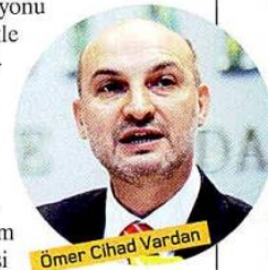
Ömer Cihad Vardan

Rakam açıklaması da Milli İstihdam Seferberliği'ne desteğini açıklayan sivil toplum kuruluşları da var. DEİK Başkanı Ömer Cihad Vardan istihdam seferberliği ile ilgili şu açıklamalarda bulunuyor: "Yeni Türkiye vizyonu çerçevesinde özellikle gençlerimizin önünü açacak istihdam alanlarını oluşturmamız lazım. İşsizliği azaltmak ve ortadan kaldırmak, verimli istihdamı geliştirmek ülkemizin başlıca gündem maddelerinden bir tanesi ve her yıl 700 bin civarında