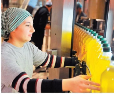
Yeni siparişlerle artan imalat sanayi, beklentilerin üzerinde bir performans gösterdi.

Ekonomik büyümenin öncü göstergesi imalat sanayi Türkiye ve Avrupa'da yükselişe geçti. Yurtiçi üretim, son üç yılın en hızlı düzeyinde büyürken, istihdam iki yılın en yüksek oranına ulaştı. Avrupa Bölgesi'nde ise önemli tüm ticari faaliyetlerde son 6 yılın en yüksek seviyesine yaklaşıldı.