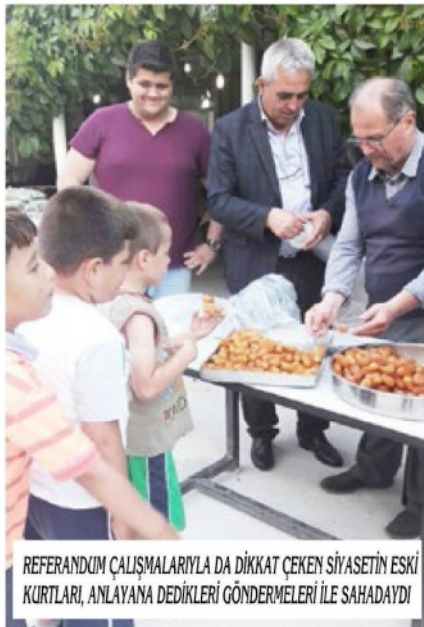
REFERANDUM ÇALIŞMALARıyla DA DİKKAT ÇEKEN SİYASETİN ESKİ KURLARI, ANLAYANA DEDİKLERİ GÖNDERMELERİ İLE SAHADAYDI