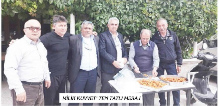
MİLİK KUVVET' TEN TATLI MESAJ

Hazır İstanbul' dan gelecek ziyaretçilerden bahsederken, biraz da detay vereyim.