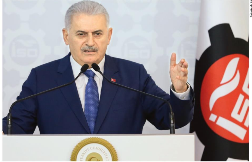
Başbakan Yıldırım, İSO'nun Beyoğlu'ndaki yeni hizmet binasının açılışı ve meclis toplantısında konuştu.

Her şey güzel de bankalar niye faizleri bu kadar yüksek tutuyor. Yüzde 14'ten parayı toplayacaksınız, sanayiye, iş adama kaçtan kullanacaksınız? Yüzde 18,19,20 inansaftysa 25'e kadar gidiyor. Bu sürdürülebilir bir şey değil. Bunu daha önce bir vesileyle söyledim. Bu hareketten önce son çağrıdır, bak açık söylüyorum; İSO'nun toplantısında söylüyorum. Tren kalkıyor hareketten önce son çağrını yapıyorum ya adam gibi makul bir faiz oranını benimsersiniz veya biz bunun tedbirini alınız. Bunu bankacılarımız bir tehdit olarak algılamasın. Elimizde araçlarımız var. Ellerinden parayı falan alacak değiliz. Aracımız olduğunu bilsinler. İstiyoruz ki doğal seyrinde işler düzelsin. Nasıl kredi garantisi fonuyla kaynak üretiysek, diğer tedbirlerimizle iş alemini rahatlatırsak, bankalar da çaresiz diye düşünmesinler. İstiyoruz ki bu, tatlılıkla olsun. Şimdi bu hükümet, bu kadar yükünü aldı, temerrütle düşecek kredilerini yeniden yapılandırdı, sizi rahatlatı, rasyolarınız arttı, karlarınız uçtu gitti. Bizde bir tabir var; el eli yıkar, el de döner yüzü yıkar. Şimdi yüz yıkama zamanıdır. Bankaların görevlerini yapmalarını sanayiciler adına bekliyoruz. Çok da zamanımız yok. Çünkü hepimiz aynı gemideyiz yani böyle bir kar sanayide var mı? Yok. Çalış, çabala, terle, akıl teri, alın teri... Sonun-