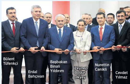
Bülent Tüfenkçi, Erdal Bahçivan, Başbakan Binali Yıldırım, Zeynep Bodur Ökyay, Nurettin Canikli, Cevdet Yılmaz

Başbakan Binali Yıldırım, İstanbul Kalkınma Ajansı'nın (İSTKA) yabancı yatırımcıların kamu kurumları nezdindeki 8 işlemi doğrudan yapabilecekleri ofisi Invest in İstanbul'un resmi açılışını yaptı. Odakule'de faaliyet gösteren Invest in İstanbul'dan hizmet alan yabancı yatırımcı, ikamet izni, çalışma izni, işyeri tescili, vergi kaydı, SGK işlemleri, işyeri açma ruhsatı, imar izni ve yapı ruhsatı işlemlerini tek elden yürütebiliyor.