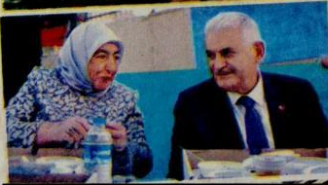
Yıldırım esi ile Gebze'de sokak iftarına katıldı.

Başbakan Yıldırım: Ya adam gibi makul bir faiz oranını benimsersiniz ya da bunun tedbirini alırız. Tehdit olarak algılamayın. Elimizde araçlarımız var.