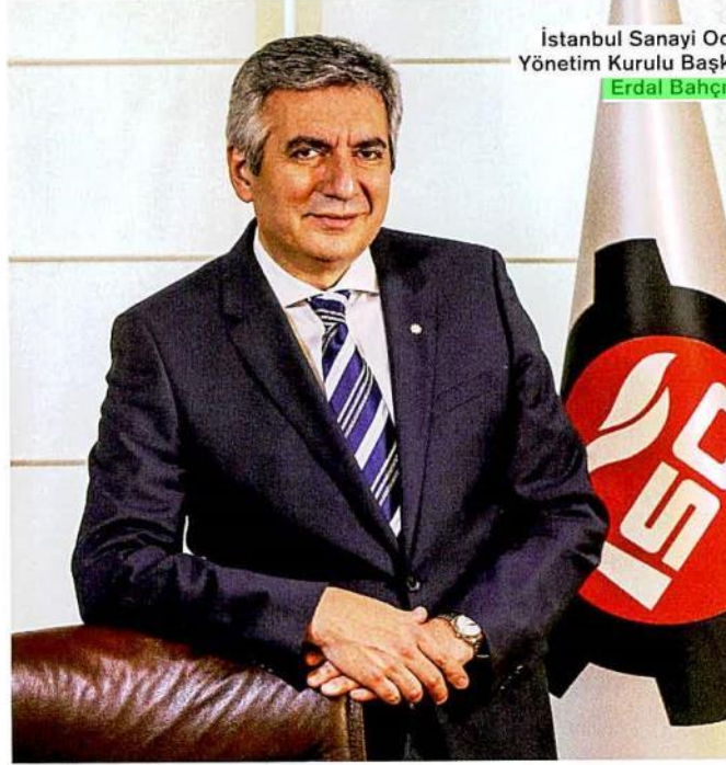
İstanbul Sanayi Odası Yönetim Kurulu Başkanı Erdal Bahçivan