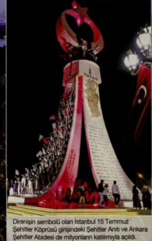
Direnişin sembolü olan İstanbul 15 Temmuz Şehitler Köprüsü girişindeki Şehitler Anıtı ve Ankara Şehitler Abidesi de milyonları katılmaya çağırdı.