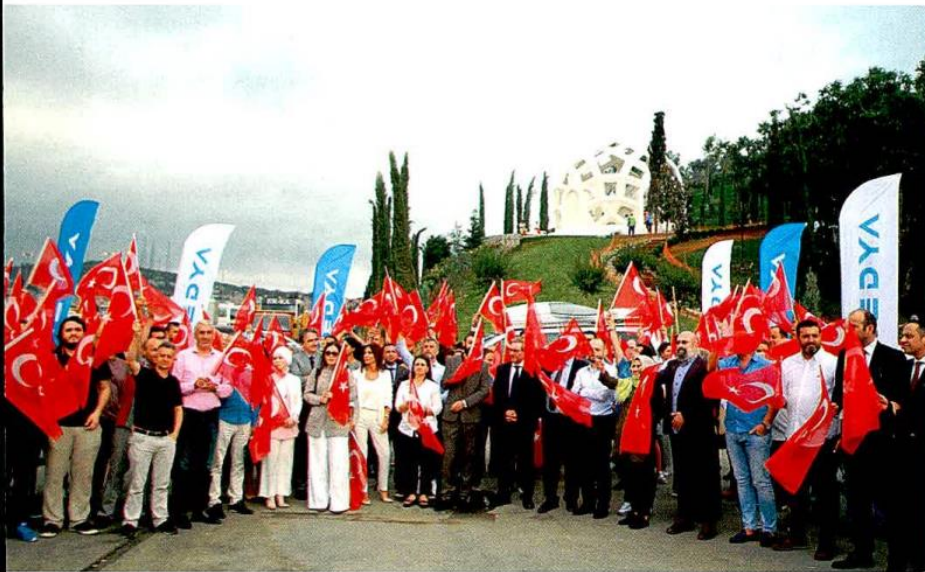
14 TEMMUZDA ESMEDYA ÇALIŞANLARI, 15 TEMMUZ ŞEHİTLER KÖPRÜSÜNDE DEMOKRASİ NÖBETİNDEYDİ.