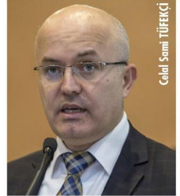
Celal Sami TÜFEKÇİ

Bahçivan, Türkiye'nin 2020'li yıllarda seri üretim aşamasına getirmeyi planladığı jet eğitim uçağı ve muharip uçak tasarımı ve üretim projesi