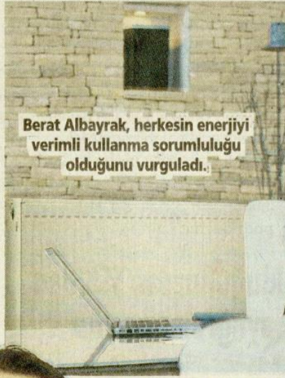
Berat Albayrak, herkesin enerjisi verimli kullanma sorumluluğu olduğunu vurguladı.

Avrupa Birliği ülkeleri arasında konuta en ucuz doğalgazı Türkiye'nin verdiğini belirten Enerji Bakanı Berat Albayrak, "Sanayide ise ikinciyiz, bunda da birinci olacağız" dedi