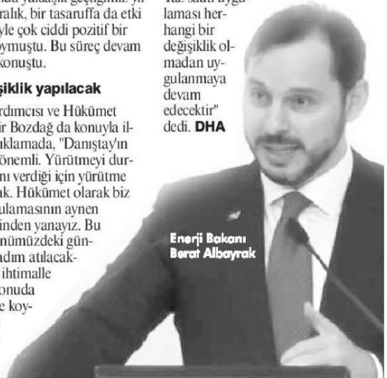
Enerji Bakanı Berat Albayrak

gerekli yasal değişiklik yapılacaktır. Yaz saati uygulaması herhangi bir değişiklik olmadan uygulanmaya devam edecektir" dedi. DHA