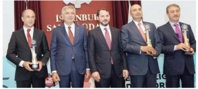
Albayrak, enerji verimliliğinde başarı gösteren firmaların temsilcilerine plaket verdi. Büyük İşletmeler kategorisinde birinciliğe Besler, ikinciliğe TOFAS, üçüncülüğe İstac layık görüldü.

ve sürdürülebilirlik açısından büyük potansiyele sahip bir alan olduğunu söyledi. 2016 yılı itibarı ile AB ülkeleri arasında haneeye en ucuz doğalgaz veren ülkenin Türkiye olduğunu belirten Bakan Albayrak, "Sanayide ise ikinciyiz. İnşallah onda da birinci olacağız. Konutlarda ise 28 AB ülkesi ortalamasının yarısından daha uygun rakamlar. Sanayide yüzde 27 daha ucuz doğalgaz temin ediyoruz. Geçtiğimiz sene devreye aldığımız projelerin ardından çok hızlı rekor düzeyde kapasite artışları yaptık. Doğal gazda olduğu gibi elektrikte de hızlı çözümler üretmek için çalışıyoruz" ifadelerini kullandı.