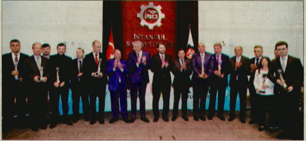
5 kategoride toplam 13 firmaya verilen ISO Enerji Verimliliği Ödülleri sahiplerini buldu. Büyük ölçekli işletmeler kategorisinde birinciliği "Kurumsal Enerji Hareketiyle Sıfır Kayıp Yolculuğu" projesiyle Besler Gıda layık görüldü. İkinciliği "Güneş Enerjisinin Üretim Proseslerinde Doğrudan Kullanımı-SolarDRY" projesi ile Tofas, üçüncülüğü ise "LNG ile Çalışan Sistemin LFG Çöp Gazı Yakıt Beslemeli Kazan Sistemine Çevrimi" projesiyle İstaç aldı.

Danıştay'ın yaz saati uygulamasıyla ilgili dünkü kararının esas yönüyle ilgili hiçbir etkisi olmadığını aktaran Albayrak, "Sadece usulle ilgili kanundaki maddenin geçerlilik süresiyle ilgili bir husus. Teknik bir konu. Arkadaşlar usulle ilgili düzeltmeyi yapıp birkaç gün içerisinde bitirip devam edecek. Aynı istikamette devam edeceğiz. Orada bir problem yok." bilgisini verdi. Albayrak, verimlilik hususunda yaz saati uygulamasının