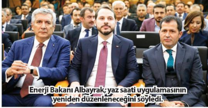
Enerji Bakanı Albayrak, yaz saati uygulamasının yeniden düzenleneceğini söyledi.