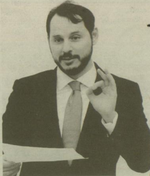
TC Enerji ve Tabii Kaynaklar Bakanı Berat Albayrak

Danıştay'ın yaz saati uygulamasıyla ilgili dünkü kararının esas yönüyle ilgili hiçbir etkisi olmadığını aktaran Albayrak, "Sadece usulle ilgili kanundaki maddenin geçerlilik süresiyle ilgili bir husus. Teknik bir konu. Arkadaşlar usulle ilgili düzeltmeyi yapıp birkaç gün içerisinde bitirip devam edecek. Aynı istikamette devam edeceğiz. Orada bir problem yok." bilgisini verdi.