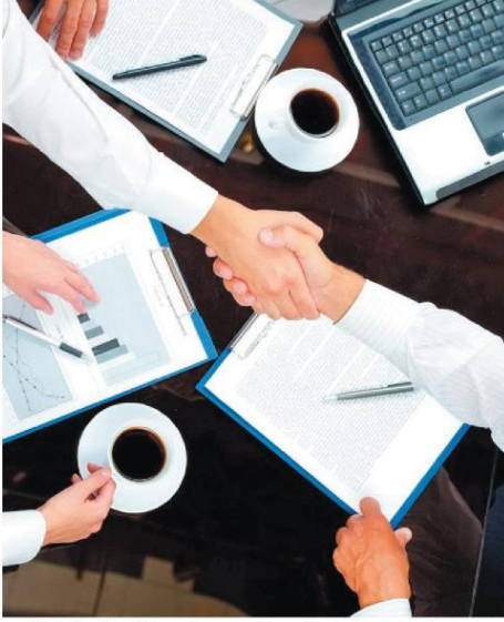
Yeni siparişlerdeki yavaşlamaya rağmen üretimin artmaya devam etmesi olumlu bir gelişme olarak kaydedildi.

İSO ve PMI endeksi nisan ayında 48.9 oldu. Türk imalatçıları tarafından alınan toplam yeni siparişler ikinci çeyreğin başında ivme kaybetti. Katılımcılar bunun piyasadan kaynaklandığını söyledi.