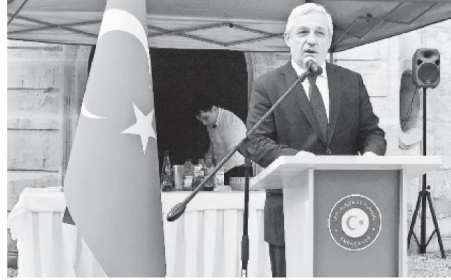
Büyükelçilik binasında yabancı gazetecilere yönelik basın toplantısı düzenleyen Büyükelçi Musa, FETÖ'nün dünyanın birçok yerinden destek aldığına işaret etti.

Musa, Türkiye'nin talebiyle, 16 ülkede faaliyet gösteren FETÖ okulları ve kurumlarının kapatıldığını da sözlerine ekledi. Musa, Türkiye'de olağanüstü halin kalkmasından sonra da FETÖ ile mücadelenin devam edeceğini belirtti. FETÖ elebaşlarının ABD, Almanya ve Yunanistan'a kaçtığını hatırlatan İsmail Hakkı Musa, "Dünyada en çok FETÖ'cü ülkesinde kabul eden ABD'dir" dedi. Musa'nın bu sözleri "CIA'yı adres gösteriyor" yorumlarına neden oldu. Musa, Fransa'da çok sayıda FETÖ'ye bağlı eğitim merkezi ve yapıların olduğuna dikkati çekerek, "Bu yapının arkasında bir istihbarat olduğunu biliyoruz. Bu istihbarat bu yapıyı finansal ve yapısal olarak destekliyor" diye konuştu. FETÖ'nün dünyanın birçok yerinden destek aldığına işaret eden Musa, Fransız makamlarına FETÖ'nün ülkedeki yapılanmaları hakkında bilgi verdiğini, bazı FETÖ'cü iş adamlarının mal varlıklarına el konulmasını istediğini ancak henüz kendisine geri dönüş olmadığını ifade etti. Bir gazetecinin, "Darbe girişiminin üzerinden iki yıl geçti, neden hala gözaltı, tutuklamalar ve ihraçlar sürüyor?" sorusuna Musa, örgüte mensup kişilere yönelik soruşturmanın zaman aldığı, bu yüzden bazı bilgilerin sonradan ortaya çıktığını sözlerine ekledi. (AA)