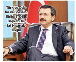
Türkiye Odalar ve Borsalar Birliği (TOBB) Başkanı Rifat Hisarcıklıoğlu