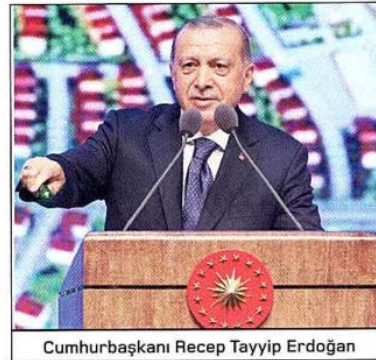
Cumhurbaşkanı Recep Tayyip Erdoğan

ticaretten şehirciliğe, eğitimden sağlığa, tarımdan teknolojiye birçok başlıktaki hedefler yer aldı. Programda bütçe ve kamu maliyesiyle ilgili atılacak adımlara da yer verildi. İlk 100 günde tamamlanacak proje sayısının binin üzerinde olduğunu söyleyen Cumhurbaşkanı Erdoğan, bu projelerden daha önemli ve öncelikli