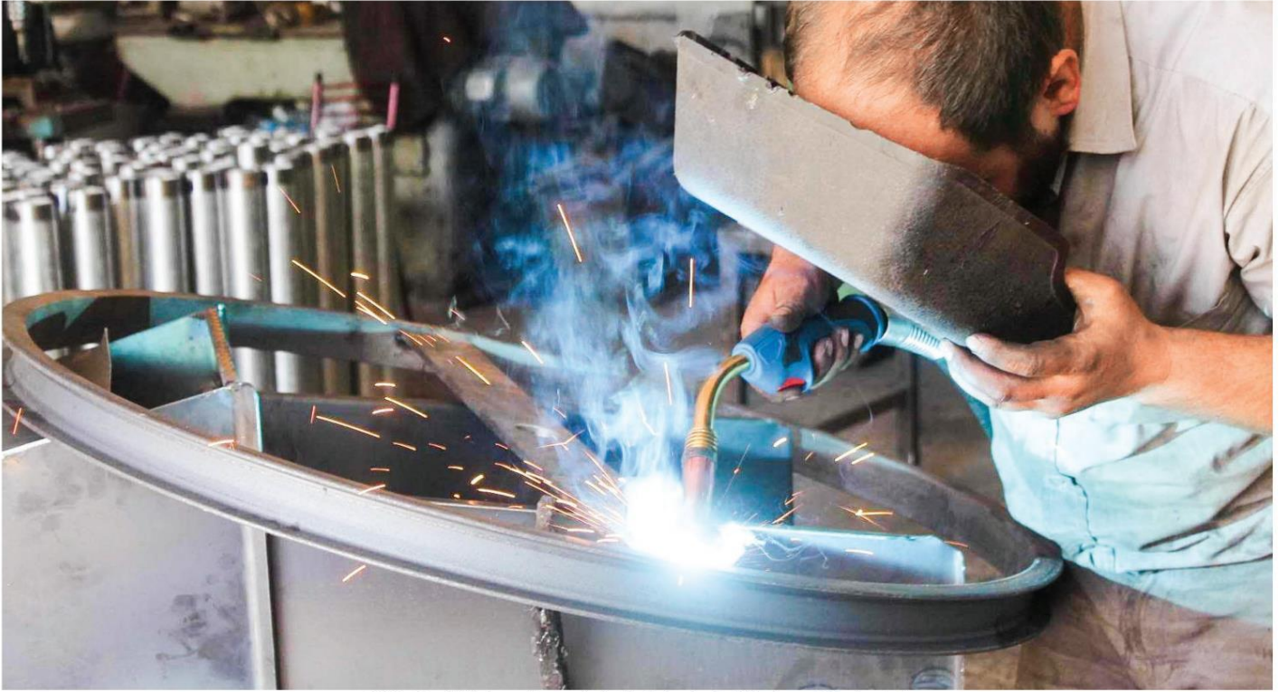
PMI, imalat sektöründe yavaşlamanın üst üste beşinci ay olacak şekilde devam ettiğine işaret etti.