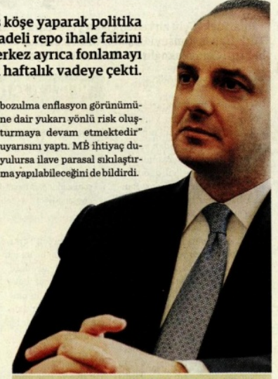
Merkez Bankası Para Politikası Kurulu, Murat Çekinkaya başkanlığında toplandı.

bozulma enflasyon görünümüne dair yukarı yönlü risk oluşturmaya devam etmektedir" uyarısını yaptı. MİB ihtiyaç duyulursa ilave parasal sıkılaştırma yapılabileceğini de bildirdi.