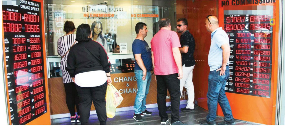
Merkez Bankası'nın 625 baz puanlık faiz artışı dolar kurunu 6.43 seviyesinden 6.01 seviyesine kadar geriledi. Borsa İstanbul, 94.000 puanı geçenken, tahvil faizleri sert düştü.