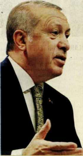
Cumhurbaşkanı Erdoğan, TESK Genel Kurulu'nda esnaf temsilcilerine seslendi.

Cumhurbaşkanı Erdoğan'ın faize yönelik açıklamalarıyla 6.56'ya kadar yükselen dolar/TL, Merkez Bankası'nın beklentilerin de ötesinde sert faiz artırmasıyla 6.01'e düştü.