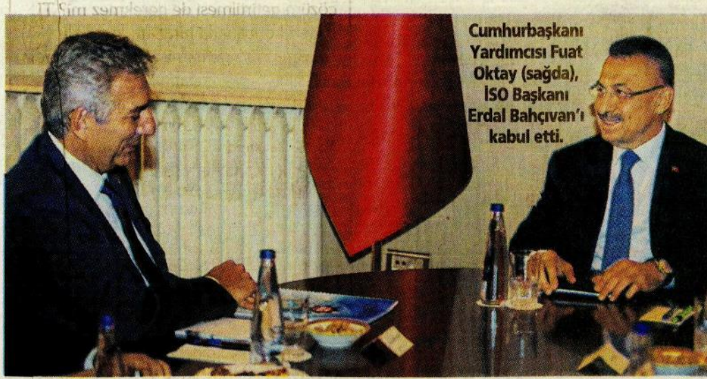
Cumhurbaşkanı Yardımcısı Fuat Oktay (sağda), ISO Başkanı Erdal Bahçivan'ı kabul etti.