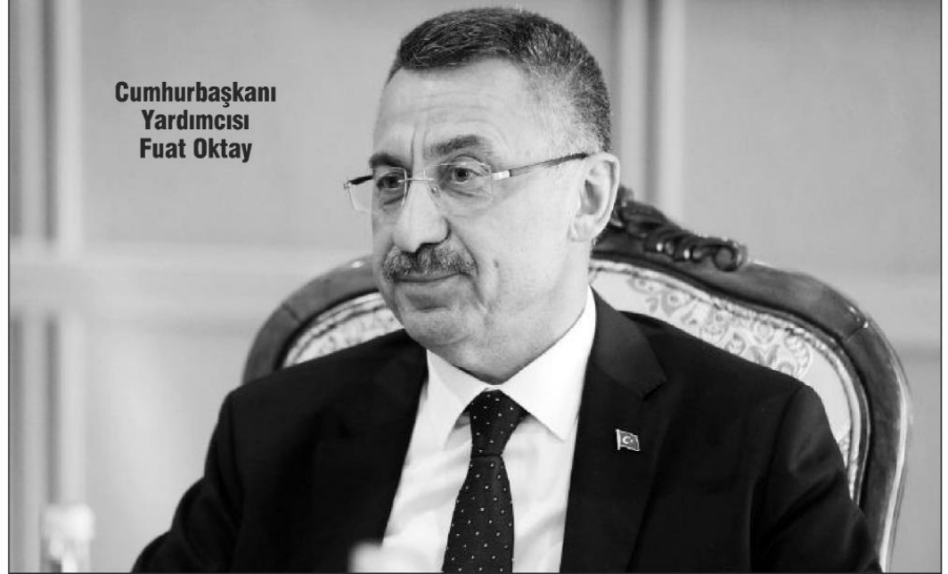
Cumhurbaşkanı Yardımcısı Fuat Oktay

Oktay şunları söyledi: "Son aylardaki finansal dalgalanma Cumhurbaşkanımızın da değindiği bir konu. Finans sektörünün açıkladığı kar rakamları ile söylemleri örtüşmüyor. Bundan en fazla acı çeken reel sektör. Katma değeri yüksek üretimle orta gelir tuzakından çıkmak istiyoruz. Kamu olarak üzerimize düşeni yapıyoruz. Savunma sanayisi bunun en güzel örneği. Diğer sektörlerde de aynı başarının gelmesini amaçlıyoruz. Stratejik yaklaşımımız ara mallarını millileştirme yönünde. Bu anlamda teşvik uygulamamızı revize ettik. Ekonomik hedefimiz doğrultusunda yatırım