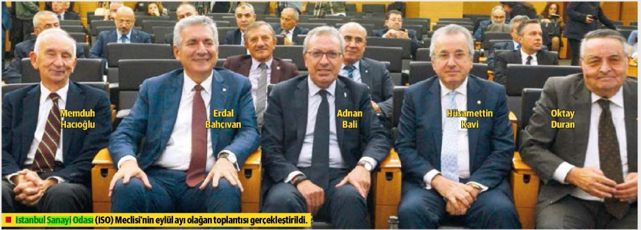
■ İstanbul Sanayi Odası (İSO) Meclisi'nin eylül ayı olağan toplantısı gerçekleştirildi.