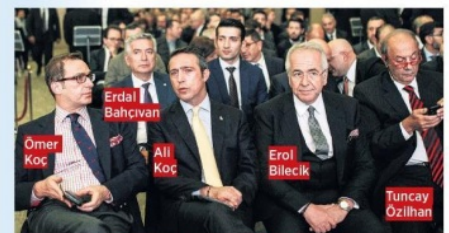
ERDAL BAĞÇIVAN / İSO Başkanı

“Üretim hız kazanacak” "Üretim hız kazanacak, vatandaşımız moral verecek bu çağrı karşısında, elbette ülkesini seven iş insanları olarak elimizi taşın altına koyacağız ve bu zorlu günleri birlikte atlatacağız. Şimdi dayanışma, paylaşma ve birlik olma zamanı."