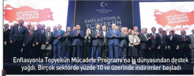
Enflasyonla Topyekün Mücadele Programı'na iş dünyasından destek yağdı. Birçok sektörde yüzde 10 ve üzerinde indirimler başladı