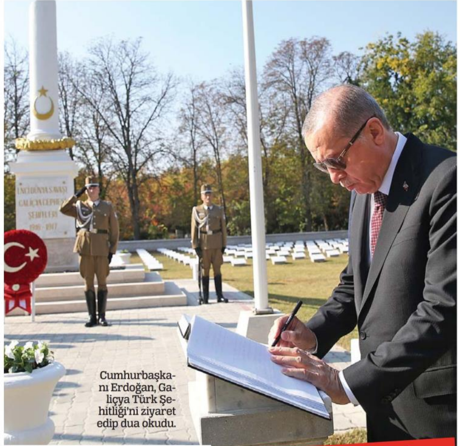
Cumhurbaşkanı Erdoğan, Galiciya Türk Şehitliği'ni ziyaret edip dua okudu.

Ticaret savaşları gibi söylemlerin ticaretimizi esir almaya çalıştığı bir ortamda Macaristan'la ekonomik iş birliğimiz çok büyük önem arz ediyor ve