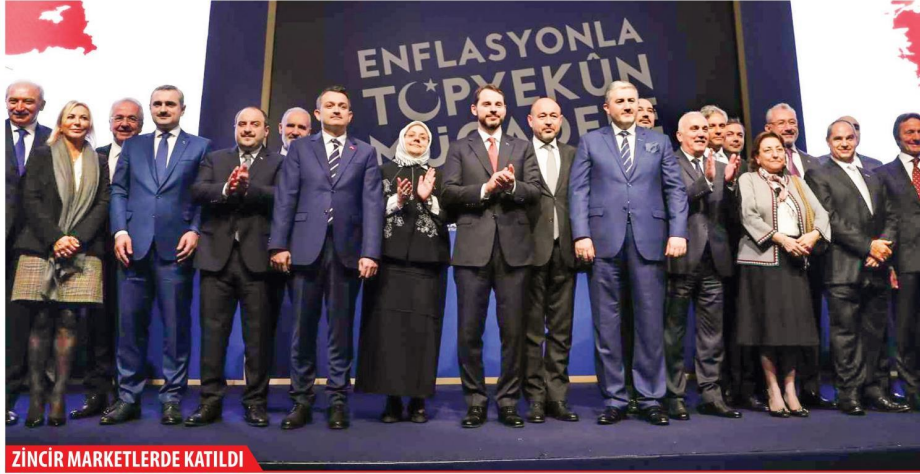
ZİNCİR MARKETLERDE KATILDI

Hazine Bakanı Albayrak'ın açıkladığı enflasyonla mücadele programının detayları açıklandı. Topyekün mücadelede Türkiye'nin 81 ilindeki firmaların ürünlerinde en az yüzde 10 indirim yapılması istendi. 2019 yılı başlarından itibaren, KDV iadeleri hızlanacak. Yapılan indirimden yüksek faizli kredi alanlarda yararlanacak.