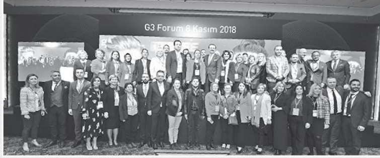
Türkiye'nin girişimcilik alanındaki en büyük etkinliği Geleceğin Gücü Girişimciler G3 Forum'un 8'incisi, “İçimde Bir Girişimci Var” ana teması ile gerçekleştirildi.

Lütfi Kırdar Kongre ve Sergi Sarayı Rumeli Salonu'nda, Türkiye Odalar ve Borsalar Birliği (TOBB) öncülüğün-