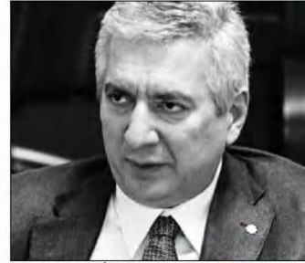
İSO Başkanı Erdal Bahçivan

lar tespit edildikten sonra, teknolojiye akılcı yatırımlar yapıldıktan sonra, Türkiye cari açık sorununu aşar." Faiz oranlarını değerlendiren Bahçivan, "Bu faiz oranları ile Türkiye'nin bırakın yeni yatırım yapması, mevcudu bile sürdürmesi mümkün değil" dedi. İSO Başkanı Bahçivan açıklamasının devamında, "Üretimin üzerindeki finansman yükünün mümkün olduğu kadar azaltılması, makule getirilmesi, hatta kökünden kaldırılması gerek" ifadelerine yer verdi.