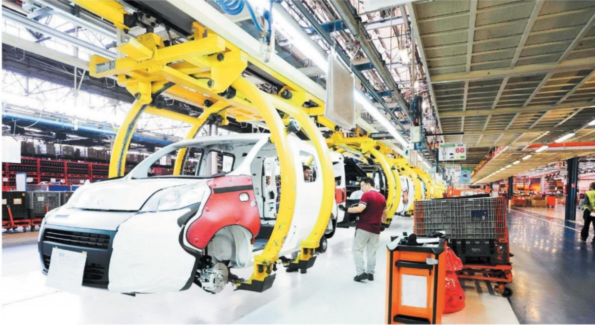
Son 12 aylık ihracat 168.1 milyar dolar olarak gerçekleşti. 2018 sonunda tarihin en yüksek yıllık ihracat rakamına ulaşılması hedefleniyor. İş dünyası gelecek dönemde Türkiye'nin itici gücünün yine ihracat olacağını vurguladı.