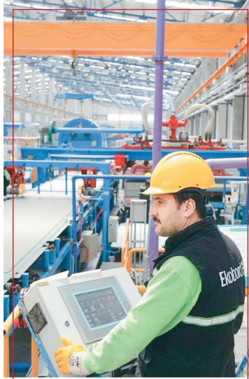
Bahçvan "Son dönemlerde tanık olduğumuz finansal dengenmeyi reel sektörde de takip etmeli" diye konuştu.