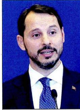
Hazine ve Maliye Bakanı Berat Albayrak

Teklifle işsizlik kapsamında ödenen ve gelir vergisinden istisna edilebilecek tazminatlar kanun isimleri zikredilerek açıklık getiriliyor. Buna göre, ilgili kanunlar çerçevesinde işverenlerce hizmet erbabına, ölüm, engellilik ve hastalık sebebiyle verilen tazminat ve yardımlar ile işsizlik ödeneği ve işe başlatılma tazminatı gelir ver-