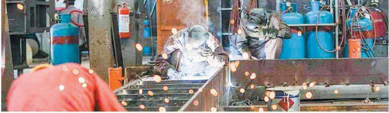
İstihdamda azalma devam etti, ancak düşüş Aralık ayına göre hafif hız kesti.