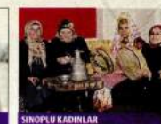
SİNOPLU KADINLAR TÜRK'in Kadın Güçlenmesi Endeksi'nde tim kendiler içinde kadınları kendilerini en güçlü hissettikleri keet olduğu için.