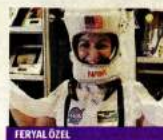
FERYAL ÖZEL NASA'daki mizaj çalışmaları ile kızlarımız STEM alanında eğitim için rol model olan bilim insanı.