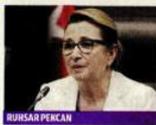
RUHSAR PEKCAN İş hayatından gelip, Cumhuriyetçiliği sistemlerin 16 balandan oluşan ilk kabinesine girmeyi başardı.