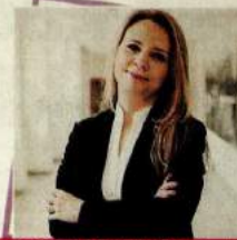
Bertil Emrah Oder/Koç Üniversitesi Hukuk Fakültesi Dekanı