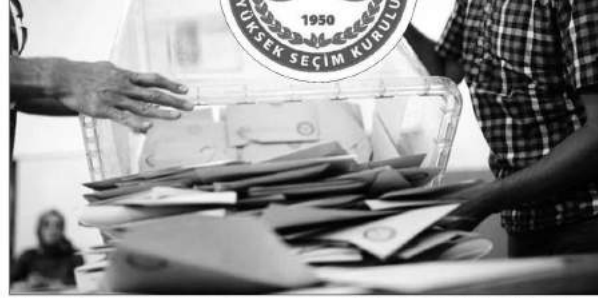
Yüksek Seçim Kurulu'nun (YSK) İstanbul seçimlerini yenileme kararına Türkiye ve Avrupa'dan büyük eleştiriler geldi.