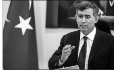
Türkiye Barolar Birliği (TBB) Başkanı Metin Feyzioglu, YSK'nın aldığı seçim kararına ilişkin basın mensuplarına açıklamalarda bulundu.

TÜRK Sanayicileri ve İş İnsanları Derneği (TUSİAD), Yüksek Seçim Kurulunun (YSK) İstanbul'da aldığı seçimlerin tekrarlama kararına tepki gösterdi. TUSİAD tarafından sosyal medyadan yapılan açıklamada, "Kapsamlı bir ekonomik ve demokratik reform gündemine odaklanmamız gereken bu dönemde, seçim ortamına geri dönmek kaygı vericidir" ifadeleri kullanıldı. Ekonomik ve demokratik reform gündemine odaklanılması gerekirken, yeniden seçim ortamına geri dönmeye endişe verici olduğu ifade edilen TUSİAD'ın açıklamasında, "31 Mart yerel seçim sonuçları açıklanmadan evvel vurgulandığı gibi, kapsamlı bir ekonomik ve demokratik reform gündemine odaklanmamız gereken bu dönemde, seçim ortamına geri dönmek kaygı vericidir" denildi.