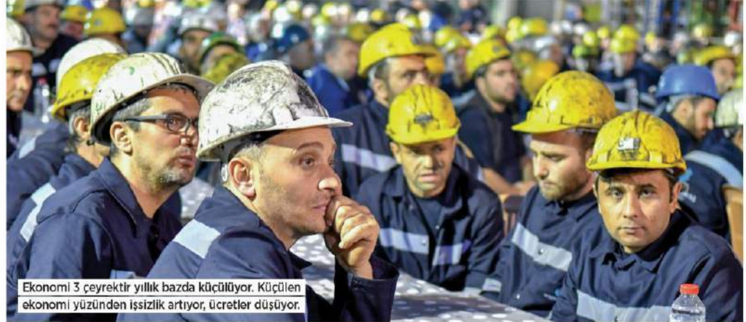
Ekonomi 3 çeyrektir yıllık bazda küçülüyor. Küçülen ekonomi yüzünden işsizlik artıyor, ücretler düşüyor.