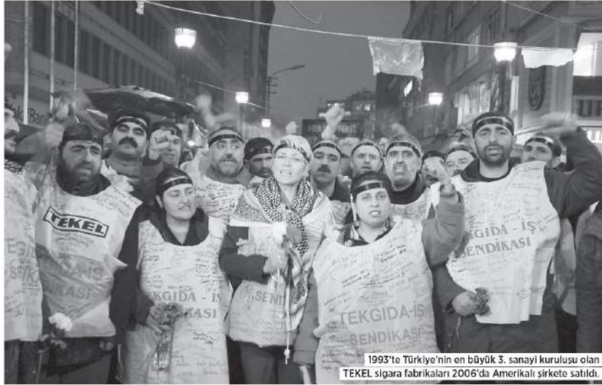
1993'te Türkiye'nin en büyük 3. sanayi kuruluşu olan TEKEL sigara fabrikaları 2006'da Amerikalı şirkete satıldı.

TÜRKİYE ELEKTRİK KURUMU (TEK): 1993'te sermayesinin tamamı kamunun elinde olan TEK, 1994'te Tansu Çiller'in başbakan olduğu dönemde bakanlar kurulu kararı ile kapatıldı ve ikiye bölündü. TEK'in sermayesi ile TEDAŞ ve Elektrik Üretim