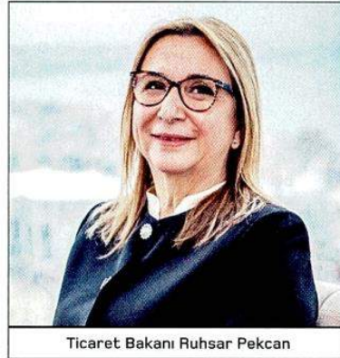
Ticaret Bakanı Ruhsar Pekcan

Hazine ve Maliye Bakanı Berat Albayrak Twitter hesabından yaptığı paylaşımında enflasyonda düşüş trendinin devam ettiğini belirterek, Haziran rakamları ile yıllık hedefin altına geldiğini belirtti. Albayrak, "Gıda