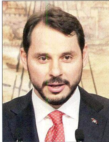
Hazine ve Maliye Bakanı Berat Albayrak

ENFLASYONDA düşüş devam ediyor. Türkiye İstatistik Kurumu (TÜİK) verilerine göre, tüketici fiyat endeksi (TÜFE) Haziran'da aylık yüzde 0.03 artarken, yıllık enflasyon bir önceki aya göre 2.99 puan azalışla yüzde 15.72'ye geriledi. Yıllık TÜFE, bu düzeyi ile Yeni Ekonomi Programı'ndaki yüzde 15.9'luk yılsonu hedefinin altında kaldı. Geçen sene yaşanan kur şokunun etkisiyle 2018 Ekim'de yüzde 25.24 ile son 15 yılın zirvesini gören yıllık enflasyon, daha sonra yönünü aşağı çevirerek 2019 Ocak'ta yüzde 20.35, Şubat'ta yüzde 19.67 düzeyinde gerçekleşmiş, Mart'ta yüzde 19.71'e yükselmesinin ardından Nisan'da yüzde 19.50'ye, Mayıs'ta ise yüzde 18.71'e gerilemişti. Haziran'da TÜFE geçen yılın Aralık ayına göre yüzde 5.01, on iki aylık ortalamalara göre yüzde 19.88 arttı. Haziran'da çekirdek enflasyon göstergesi "B" endeksinin yıllık değişim oranı 0.62 puan düşüşle yüz-