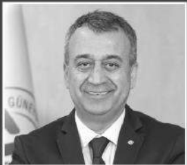
KİLECİ: MORAL BULDUK