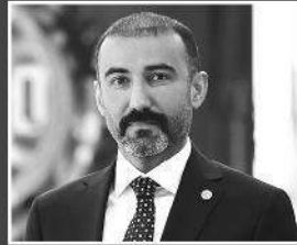
YILDIRIM: GAZİANTEP'İ PARLAK BİR GELECEK BEKLİYOR