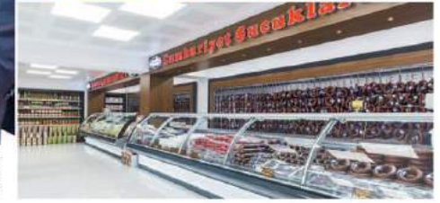
ATSO Başkanı Hüsnü Serteser, 500 büyük sanayi kuruluşları arasında yer alan Oruçoğlu Yağ ve Cumhuriyet Sucukları firmalarını kutlayarak, Afyonkarahisar'ın kalkınmasının sürdürülmesinde, ülke çapında üretim yapan ve önemli ölçüde istihdam sağlayan sanayi kuruluşlarımızın önemi büyüktür" dedi