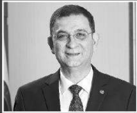
ÜNVERDİ: FİRMALARIMIZI KUTLUYORUZ