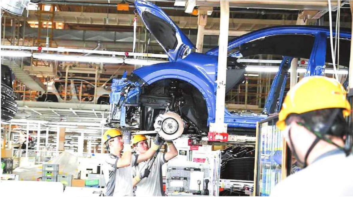
Mayısta madencilik ve taş ocaklığı sektörü endeksi bir önceki aya göre yüzde 5,2 imalat sanayi sektörü endeksi yüzde 1 yükseldi.