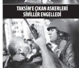
TAKSİM'E ÇIKAN ASKERLERİ SİVİLLER ENGELLEDİ