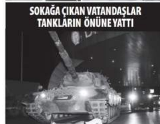
SOKAĞA ÇIKAN VATANDAŞLAR TANKLARIN ÖNÜNE YATTI