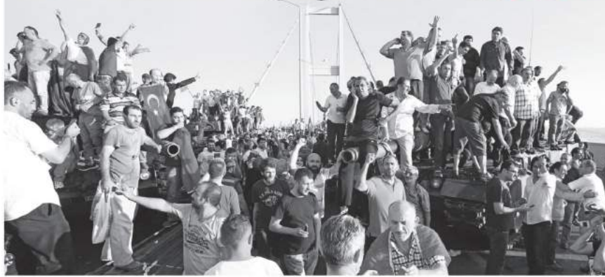
Darbe girişiminin ilk saatlerinde kapatılan eski adıyla Boğaziçi Köprüsü, sabah saatlerinde tamamen askerlerden temizlendi. Cuntaya karşı direnen sivilere ise köprüye getirilen tanklara üzerine çıkarak kutlamaya yöneldi.

F ETÖ'nün 15 Temmuz akşamı devletin silahlarını millete doğrultmasını üzerinden 3 yıl geçti. 251 kişi şehit, 2 bin 194 kişiyi de yaralayan darbe girişimini isteyen FETÖ'nün hain planında olayların merkez üssü Ankara oldu. İhanet girişimi İstanbul'da eski adı Boğaziçi Köprüsü olan 15 Temmuz Şehitler Köprüsü'ne saat 21.52'de kapatılmasıyla başladı. FETÖ'cü darbeciler kalkışma aşında 16 Temmuz sabaha karşı saat 03.00'da başlamayı planlamıştı. Ancak Kara Havacılık Komutanlığında görevli bir subayın saat 16.16'da MIT Müsteşarlığı'na giderek kalkışmanın olacağını anlatmasıyla girişim erkene alındı. Kalkışma için merkez üs olarak Akıncı Üssü olarak kullanıldı. Burada örgütün sivil imamları cuntacı askerlerle darbeyi koordine etti. Türkiye Cumhuriyeti tarihine kara bir leke olarak giren gecede FETÖ'cü ordu için suzunu 8 binin üzerinde askeri personel, savaş uçakları da dahil 35 uçak, 3 gemi, 37 helikopter, 74'ü tank 246 zırhlı araç ve 4 bine yakın hafif silahlı araç kullanıldı.