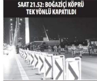
SAAT 21.52: BOĞAZIÇI KÖPRÜ TEKYÖNLÜ KAPATILDI

Kalkışmanın ilk saatlerinden itibaren hareket geçen Özel Harekat Polisleri ve kalkışmaya karşı olan askerler FETÖ'cü cuntanın ele geçirdiği bütün kalya ve kuramları tek tek geri aldı. Yakalanan darbeciler hızla karakollara emniyete götürüldü. Burada yapılan işlemlerde sokağa çıkışta askerler önce savaçlıkları ardından da mahkemeye çıkarılarak tutuklandı.