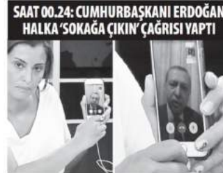
SAAT 00.24: CUMHURBAŞKANI ERDOĞAN HALKA 'SOKAĞA ÇIKIN' ÇAĞIRISI YAPTI