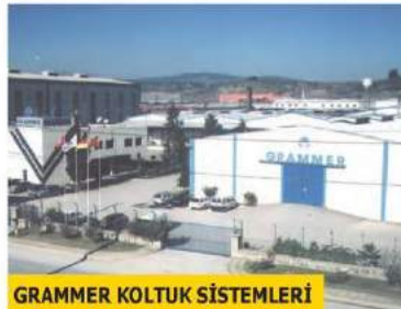
GRAMMER KOLTUK SİSTEMLERİ