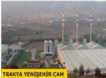
TRAKYA YENİŞEHİR CAM

27,8 gibi oldukça güçlü bir artışla 107,6 milyar TL'den 137,5 milyar TL'ye yükseltti. Bu artış 2017 yılında da yüzde 30,9 gibi oldukça yüksek bir oranda gerçekleşmişti. 2018 yılı Türkiye'nin İkinci 500 Büyük Sanayi Kuruluşu