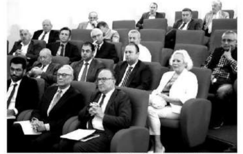
Toplantıya çok sayıda oda üyesi katılım gösterdi.