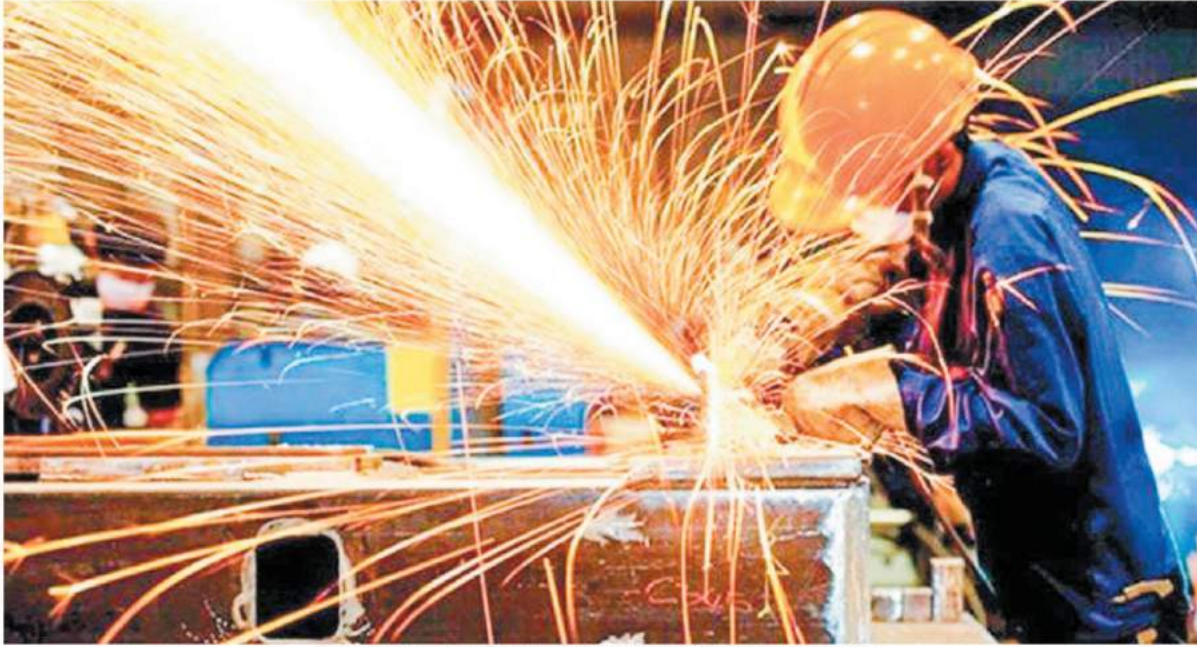
PMI'ya göre, yeni siparişlerin yeniden büyümeyle başlamasıyla birlikte istihdam son 14 ayda ilk kez artış kaydetti.