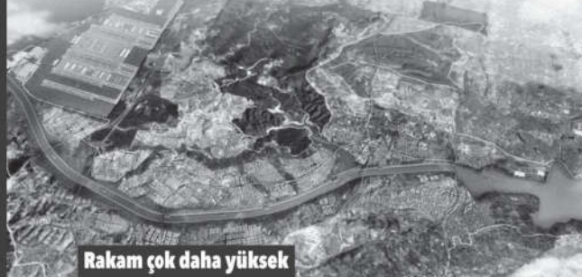
Rakam çok daha yüksek

Yeni Havalimanı'nın metro inşaatı kaynak yetersizliği yüzünden yapılamazken, Kanal İstanbul projesi için 75 milyar TL'nin bütçeden aktarılması gündemde. Uzmanlar ise uyarıyor; milletlin bütçesi refahı artıracak alanlara aktarılmalı. Tarım ve sanayideki problemler önceliğimiz olmalı