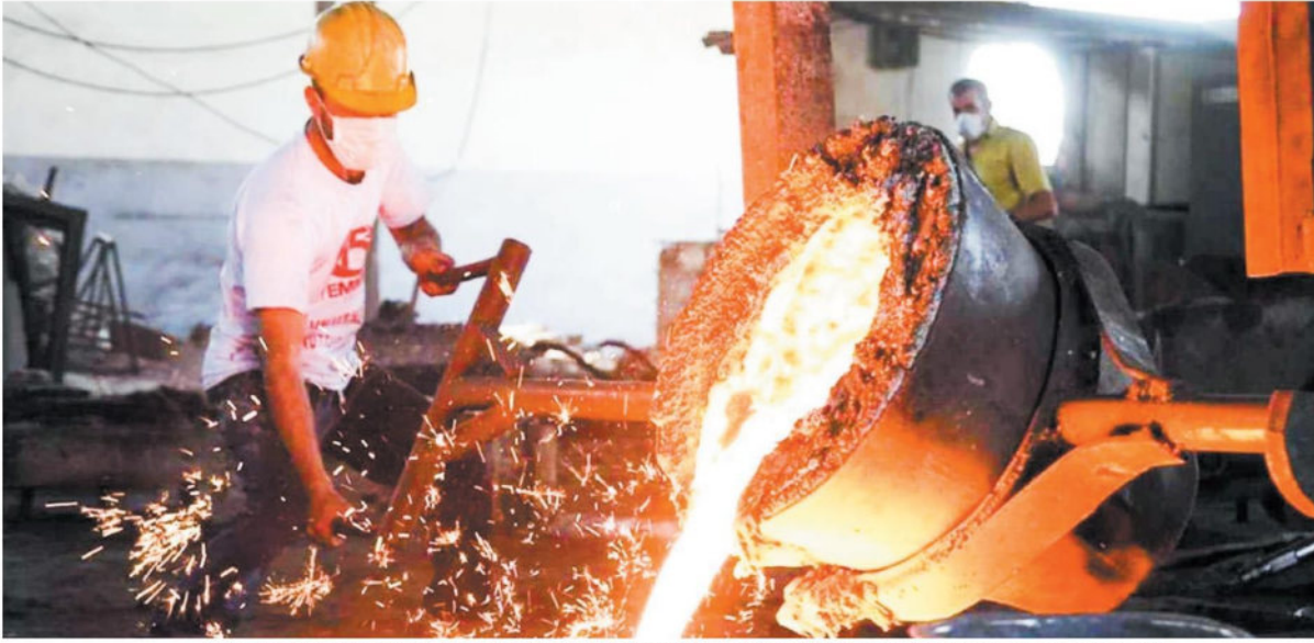
Aralık ayında üretim gereksinimlerindeki artışa bağlı olarak firmalar satın alma faaliyetlerini hızlandırdı. 2 yıldır süren düşüşün ardından girdi alımlarının yatay seyretmesine yardımcı oldu.