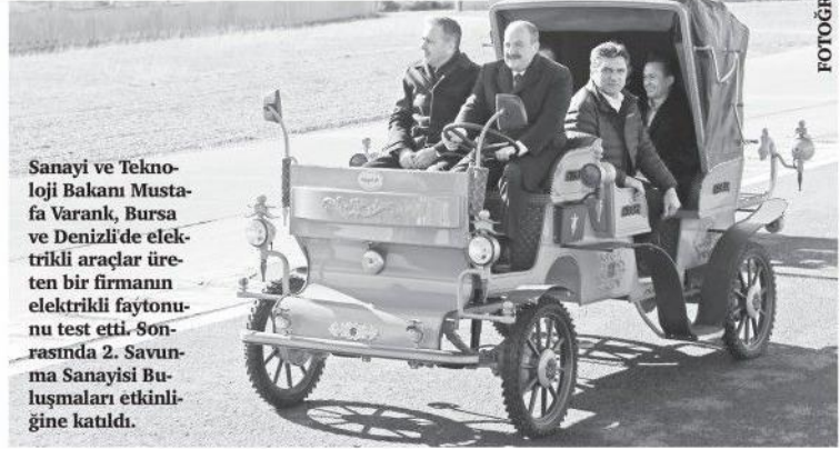
Sanayi ve Teknoloji Bakanı Mustafa Varank, Bursa ve Denizli'de elektrikli araçlar üreten bir firmanın elektrikli faytonunu test etti. Sonrasında 2. Savunma Sanayisi Buluşmaları etkinliğine katıldı.

temasıyla 2. Savunma Sanayisi Buluşmaları etkinliğine katılan Bakan Varank, "Biz kendi öz sermayesiyle yatırım yapan işletmelerimizi destekleyecek mekanizmalar için çalışıyor, projeler geliştiriyoruz. Bu fonları çok artırmamız ve geliştirmemiz lazım. Türkiye'nin potansiyeline ve sanayicilerin yapabileceklerine çok büyük bir güven duyuyoruz. Kamu ve özel sektördeki tüm paydaşlarla yakın iş birliği içinde çalışmaya devam edecek, geliştirdiğimiz ürün ve teknolojilerle, inşallah pek çok ülkenin gıptayla takip ettiği yeniliklere de imza atacağız" ifadelerini kullandı. ●İSTANBUL-AA