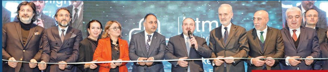
Bilgiyi Ticarileştirme Merkezi'nin Fulya'daki 3 bin metrekarelik yeni yerleşkesinin açılışına Sanayi Bakanı Varank da katıldı.

Değeri 1 milyar $'ı aşan 'Turcorn'lar çıkarma hedefi için kurulan Bilgiyi Ticarileştirme Merkezi'nin yeni yerleşkesi hizmete açıldı. Sanayi Bakanı Varank, merkezin vizyoner fikirleri dünyayla buluşturacağını ve girişimcileri finansmana ulaştıracağını söyledi.