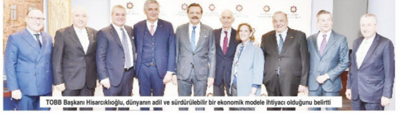
TOBB Başkanı Hisarcıklıoğlu, dünyanın adil ve sürdürülebilir bir ekonomik modele ihtiyacı olduğunu belirtti

Hisarcıklıoğlu, dünyanın daha adil ve sürdürülebilir yeni bir ekonomik modele ihtiyacı olduğunu dile getirdi. Kapitalizmin dönüşüme ihtiyacı olduğuna dikkati çeken Hisarcıklıoğlu, şu değerlendirmelerde bulundu: "Yeni bir iktisadi, hukukî ve çevreye saygılı bir altyapıyı kurup, adil ve istikrarlı bir büyüme modeline dünyanın ihtiyacı var, dünyanın buna geçmesi lazım. Kapitalizm, yeniden kendini tarif etmeli. Türkiye'ye baktığımızda, 2019'a sıkıntılı başladık, 2019'un son çeyreği için yüzde 5'lik büyüme bekliyorum. İş dünyası olarak bu hedefe kilitlendik, risklerimiz var ama fırsatlara iyi odaklanmalıyız." >>>Gazete3