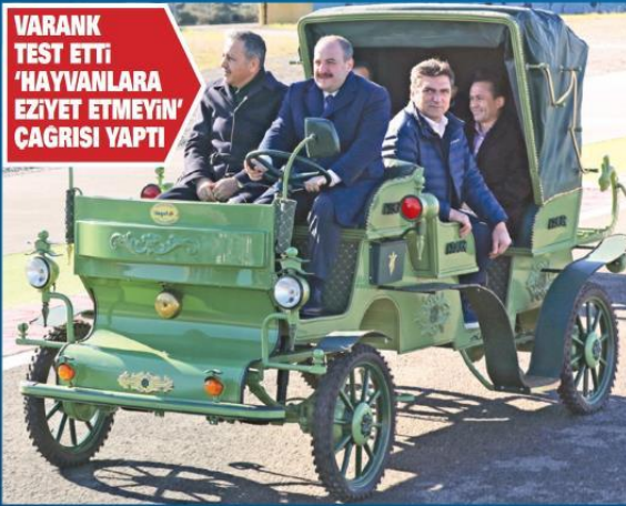
VARANK TEST ETTİ 'HAYVANLARA EZİYET ETMEYİN' CAGRISI YAPTI