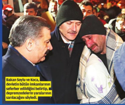
Bakan Soylu ve Koca, devletin bütün imkanlarını seferber edildiğini belirtip, depremezelerin yaralarının sarılacağını söyledi.