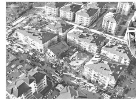
Elazığ'da meydana gelen depremdе, ilk merkezinde bazı binalar çöktü. Yetkililer arama kurtarma çalışmalarına devam ediyor. Bir çok kişi enkaz altından sağ kurtarıldı.

Türkiye Afet Müdahale Planı'na göre, arama kurtarma ve sağlık destek çalışmalarının kesintisiz yürütülmesi amacıyla AFAD koordinasyonunda 28 çalışma grubunun "7 gün 24 saat" çalışması esasına göre faaliyete geçirildiği belirtildi.