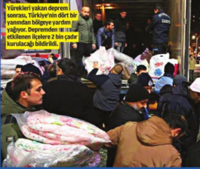
Yüreklere yakan deprem sonrası, Türkiye'nin dört bir yandan bölgeye yardım yağıyor. Depremden etkilenen ilçelere 2 bin çadır kurulacağı bildirildi.