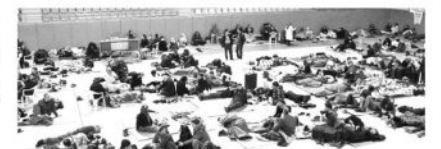
Elazığ'da Gençlik ve Spor İl Müdürlüğü bünyesindeki Yakup Kılıç Spor Salonu'nun kapıları depremden dolayı açıldı. Burada sığınak kurulumuna çalışmaları batıya taşındı.