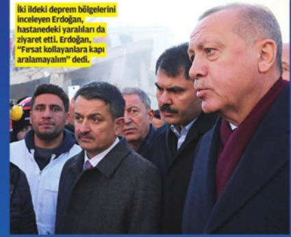
İki ildeki deprem bölgelerini inceleyen Erdoğan, hastanedeki yaralıları da ziyaret etti. Erdoğan, "Fırsat kollayanlara kapı aralamayalım" dedi.

Yardım kuruluşları, soğuk hava şartlarında sokakta kalan depremezdelere, gıda ve giyecek yardımları dağıtıp, mobil aileleri kurdu. Bakanlar, Süleyman Soylu, Fahrettin Koca ve Murat Kurum, çalışmalarını yerinde inceleyip halka moral verdi. Programlarını iptal ederek, deprem bölgesine koşan Başkan Erdoğan da, mağdur ve acılı vatandaşlara, "Yalnız değilsiniz. Devlet ve millet yanınızda" mesajı verdi.