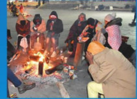
Sivrice'de meydana gelen deprem sonrası en büyüğü 5.4 şiddetinde, 401 artçı deprem kaydedildi. Vatandaşlar ateş yakarak geçiyi, sokaklarda ve parklarda geçirdi.

■ Tüm bölgeyi etkileyen deprem hem milleti hem de kurum ve kuruluşları kenetledi. Acı haberin ardından harekete geçen il ve ilçe belediyeleri bölgeye TIR'larla giyecek, gıda, çocuk bezi, uyku seti, battaniye ve jeneratör gönderdi. Hazine ve Maliye Bakanlığı, Elazığ ve Malatya'daki vatandaşların vergi borçlarını mücbir sebep ilanyla 3 ay erteledi. • HABERLERİ 4-9'DA