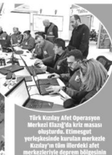
Türk Kızılay Afet Operasyon Merkezi Elazığ'da kriz masası oluşturdu. Etilmesigut yerleşiminde kurulan merkezle Kızılay'ın tüm illerdeki afet merkezleriyle depremin bölgesinin koordinasyonu sağlanıyor.