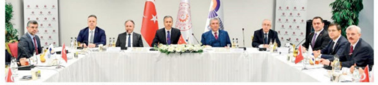
İstanbul Kalkınma Ajansı'nın (İSTKA) 20. Kalkınma Kurulu Toplantısı; İSTKA Yönetim Kurulu Başkanı İstanbul Valisi Ali Yerlikaya başkanlığında gerçekleştirildi.

İ stanbul Kalkınma Ajansı'nın (İSTKA) 20. Kalkınma Kurulu Toplantısı'nda konuşan İstanbul Valisi Ali Yerlikaya, "İSTKA, bugüne kadar, mali destek programları ve diğer destekler kapsamında 809 projeye 700 milyon TL destek sağladı" dedi.