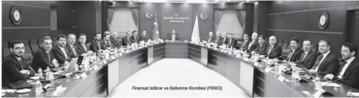
Finansal İstikrar ve Kalkınma Komitesi (FIKKO)

Birçok ilde reel sektörün sorunlarını dinleyen Hazine ve Maliye Bakanlığı, bankaların uygulamalarına yönelik şikayetler üzerine düğmeye bastı. Merkez Bankası dün yaptığı düzenleme ile EFT ücretleri başta olmak üzere bankaların faiz dışında aldığı ücret, masraf, komisyonlara sınırlamalar getirdi