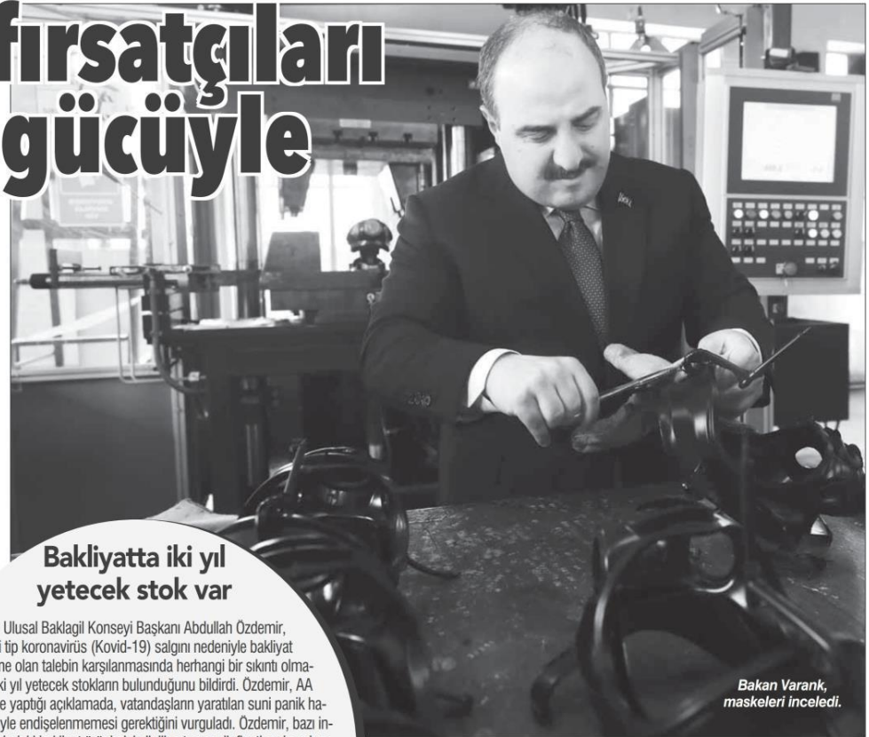
Bakan Varank, maskeleri inceledi.

Sanayi ve Teknoloji Bakanı Mustafa Varank dün yaptığı açıklamada, maske fiyatlarındaki oynaklığın arz talep dengesizliğinden kaynaklanmadığını belirterek, "Maske yeterince arz fazlası var ama birtakım