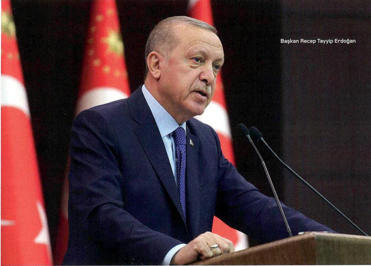
Başkan Recep Tayyip Erdoğan